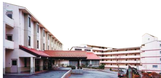
パサージュ木曽駒高原リゾート

創業以来変わらない福利厚生として、年1回の社員旅行があります。行き先は、社員のアンケートなどで決め、全員が参加したいと思ってくれ、楽しかったと言ってくれる旅行を企画。世の中の動向にかかわらず、一番大切な社員をねぎらう行事として毎年続けていくことが、会社の使命だと考えています。