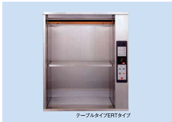
テーブルタイプERTタイプ