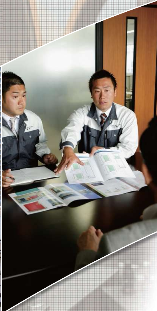
●営業・プレゼン風景●