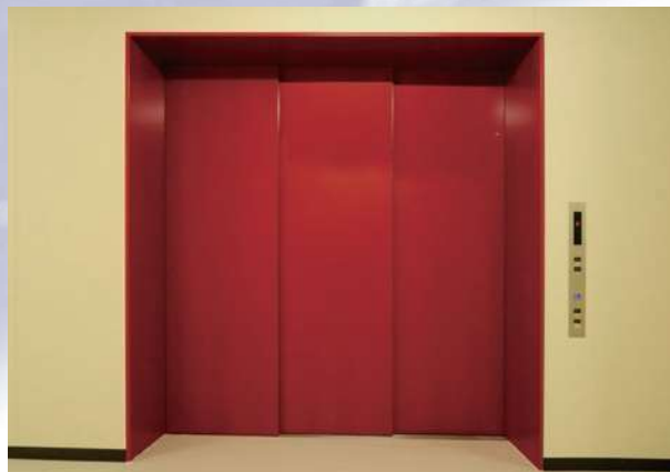
3枚片開き戸・のりば