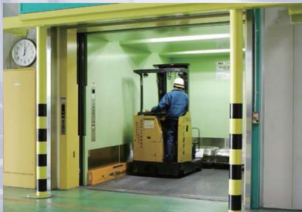
荷物用エレベーター 多頻度の使用やフォークリフトによる荷物の搬入・搬出に、頑丈な構造と使い易さでタフにお応えし、工場や倉庫での荷役作業に貢献します。 ●マシンルームレスのロープ式、油圧式により積載量600~6,000kgで標準機種を用意しています。