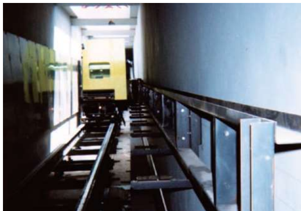
斜行エレベーター ●傾斜地に設ける移動手段の一つです。