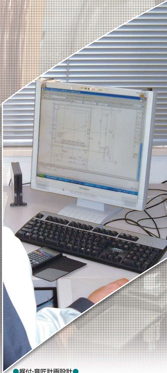
●据付・意匠計画設計●