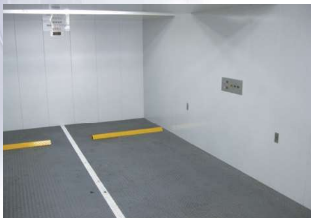
自動車用エレベーター ●マシンルームレスのロープ式、油圧式により積載量2,000~3,500kgで標準機種を用意しています。